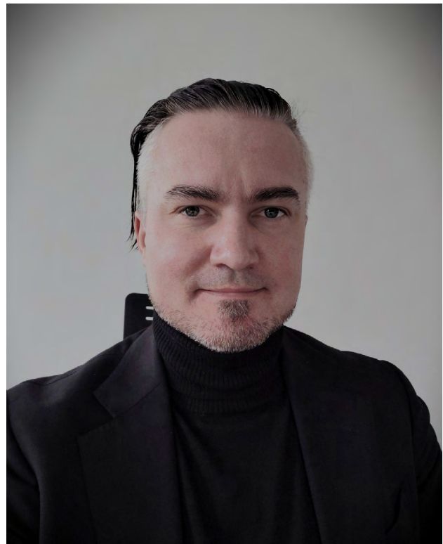
Šarūnas Alasauskas, Higienos instituto direktorius

2022 m. įvykusi reorganizacija, kai prie Higienos instituto buvo prijungtos kelios kitos sveikatos priežiūros